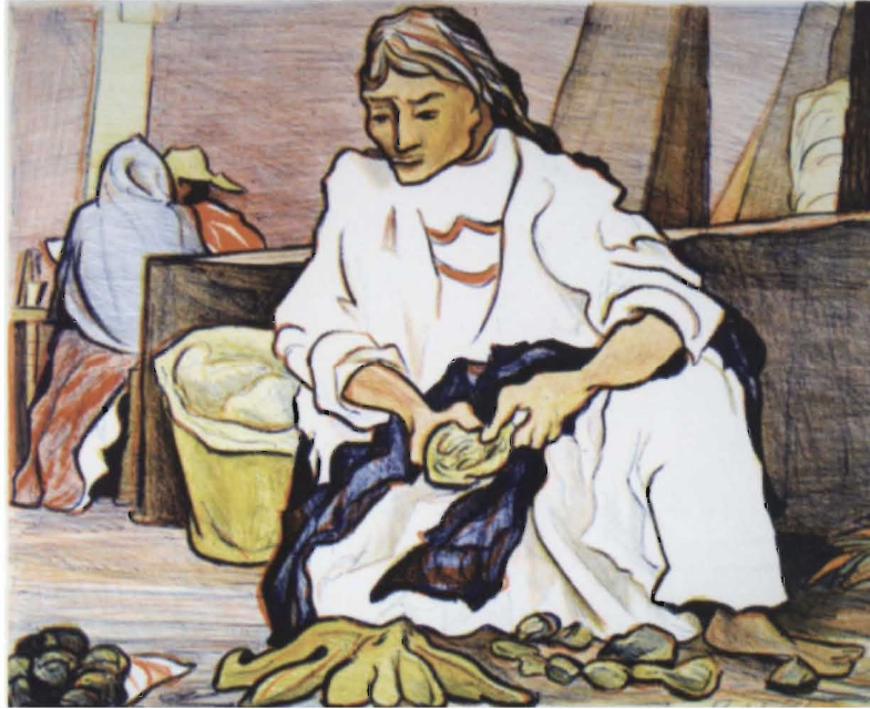
PABLO O'HIGGINS, THE MARKET , COLOR LITHOGRAPH, COLLECTION OF NORMAN AND JUDY ZLOTSKY