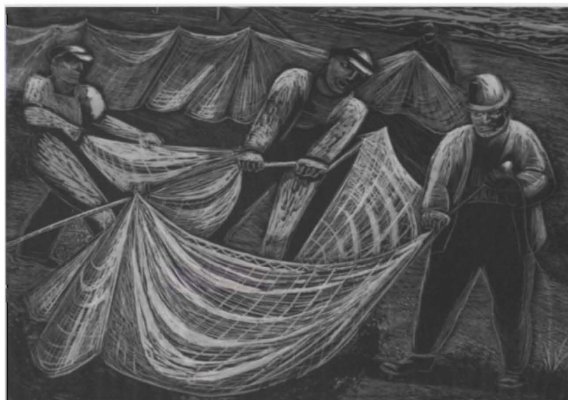
ELIZABETH OLDS, MENDING NETS, ABOUT 1935, WOOD ENGRAVING, UNL-ALLOCATION OF THE U.S. GOVERNMENT, FEDERAL ART PROJECT OF THE WORKS PROGRESS ADMINISTRATION