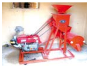
Décortiqueuse de céréales