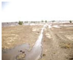
La rentrée d'eau dans le lac Faguibine, zone de production du sorgho de décrue