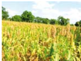
Champs d'une variété améliorée de sorgho, Grinkan à Garasso