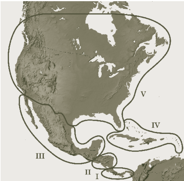
Figura 2. Mapa del área de estudio indicando las fases del proyecto del inventario de los dynástinos.

estudio, utilizando un programa diseñado para proveer una cobertura geográfica razonablemente completa y que tome en cuenta la variación en estacionalidad de la actividad de los dynástinos adultos.