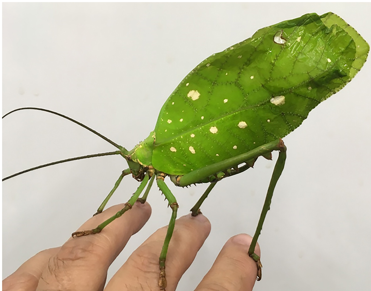
Fig. 1. Vista del ejemplar vivo de Celidophylla albimacula Saussure y Pictet, 1898 (Orthoptera: Tettigoniidae).

ser una región montañosa dentro de la cordillera central, que alcanza los 1185 msnm, tiene un clima húmedo con una temperatura anual promedio de 21°C y una precipitación anual de 2500 mm.