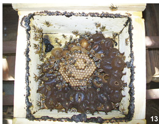
Figuras 8–13. Colmenas manejadas de Melipona beecheii . 8–9) Troncos huecos, Catalina de Güines y Sierra La Güira, Pinar del Río, respectivamente. 10) Cajas rusticas, Las Terrazas, Pinar del Río. 11) Caja racional UTOB, Ciénaga de Zapata. 12–13) Caja racional modelo modificado Fernando Oliveira, San Nicolás de Bari, Mayabeque.