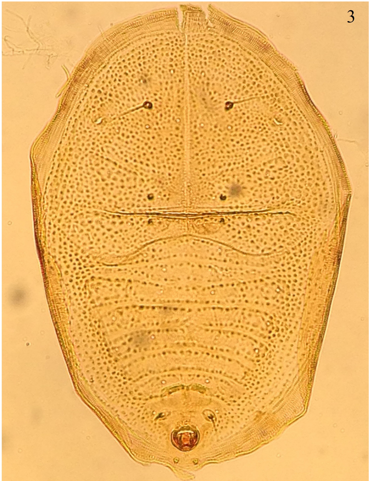
Figura 3. Aleuropleurocelus chamaedoreaelegans Sánchez-Flores y Carapia-Ruiz sp. nov., dorso pupa forma circular.