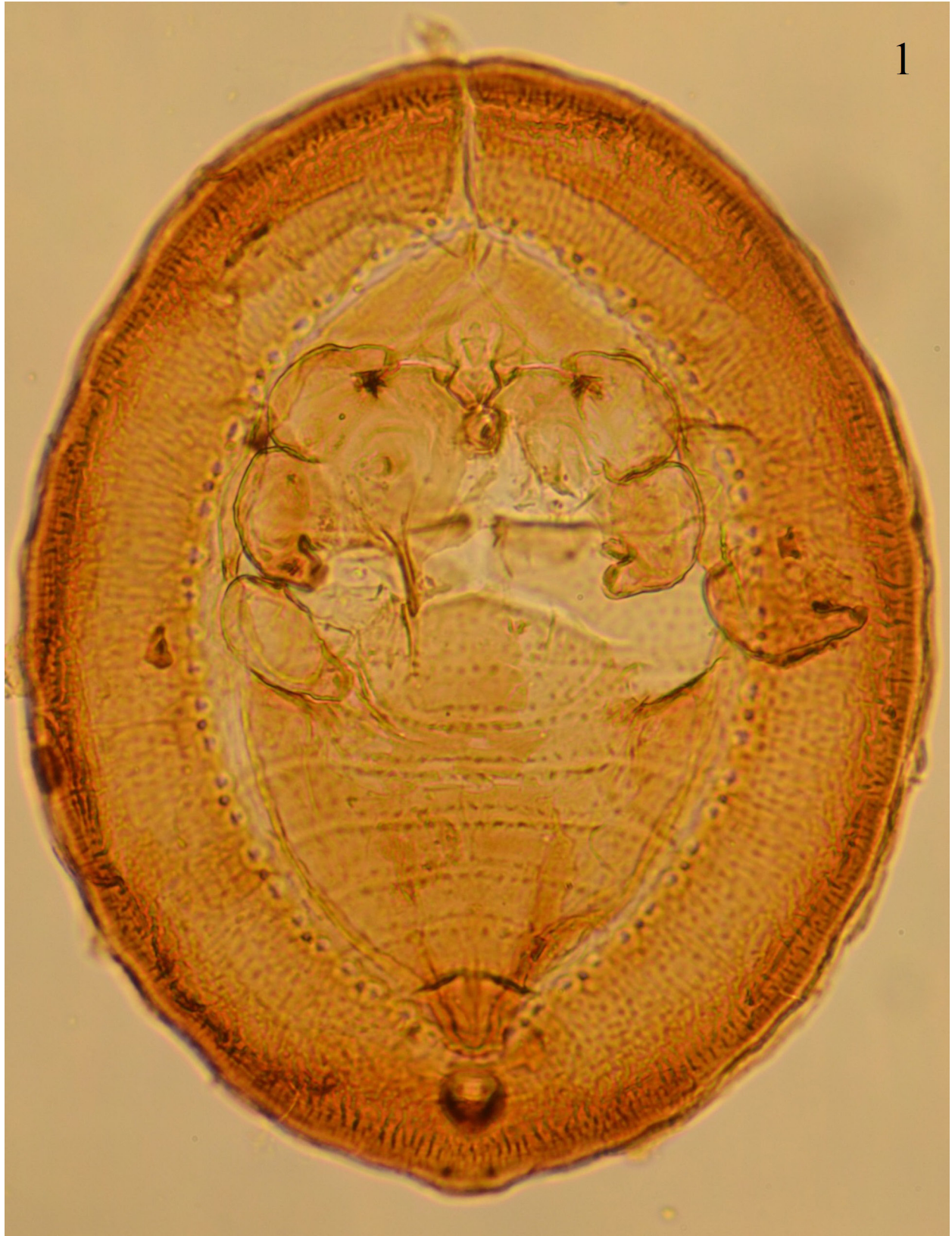
Figura 1. Aleuropleurocelus chamaedoreaelegans Sánchez-Flores y Carapia-Ruiz sp. nov., pupa forma circular.