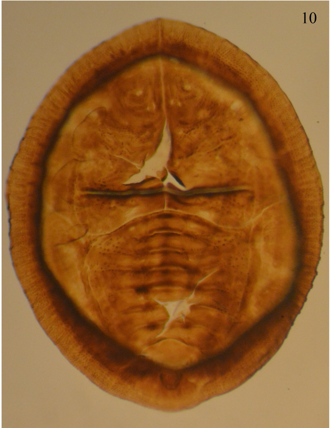
Figura 10. Aleuopleurocelus guerrerensis Carapia-Ruiz y Sánchez-Flores, 2018. Pupa forma circular.