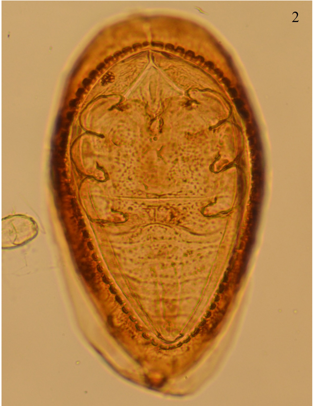
Figura 2. Aleuropleurocelus chamaedoreaelegans Sánchez-Flores y Carapia-Ruiz sp. nov., pupa forma de bote.