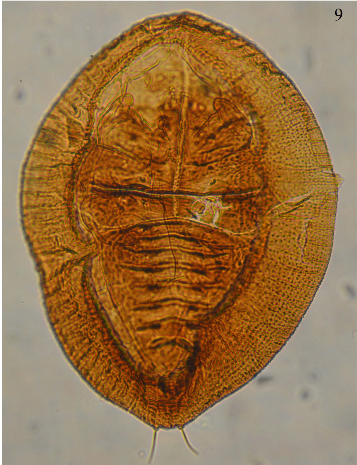
Figura 9. Aleuropleurocelus guerrerensis Carapia-Ruiz y Sánchez-Flores, 2018. Pupa forma de bote.