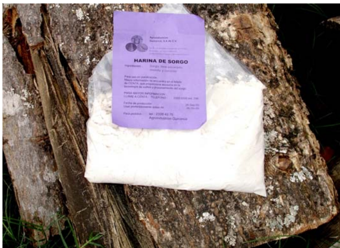
Bolsa de harina de sorgo molida por Agroindustrias Gumarsal, para ser evaluada por las panaderías. En la etiqueta informativa de la bolsa se indica: para mayor información sobre el uso de la harina de sorgo en panadería refierase al boletín adjunto o llame al CENTA.

¿Qué factores evitan que el sorgo sea usado en una gran extensión por los panaderos? Principalmente, la fuerte competencia con el trigo porque (1) la importación del trigo la subsidia el gobierno lo que hace que los precios bajen, (2) históricamente, las panaderías están acostumbradas a hornear con harina de trigo, (3) el oligopolio del trigo desalienta el uso del sorgo.