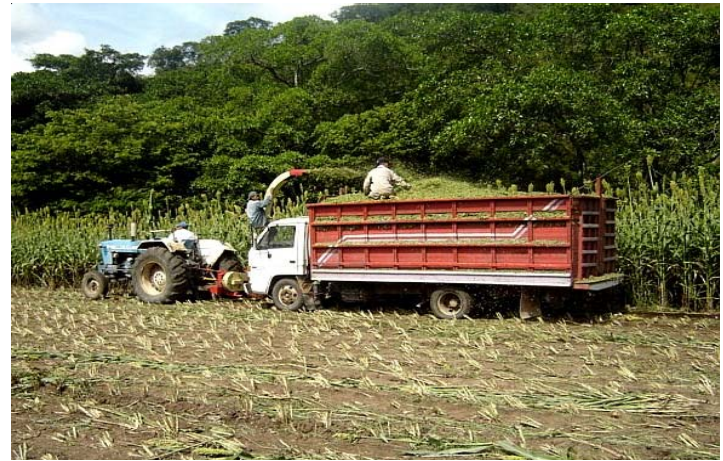
Corte del sorgo forrajero CENTA SS-44 en El Salvador