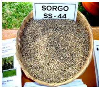
Semilla de CENTA SS-44