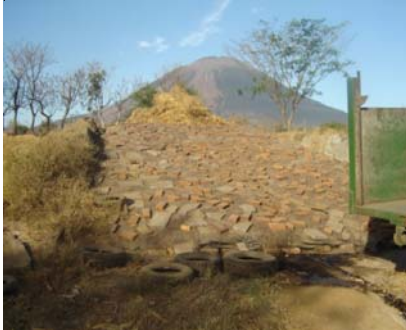
CENTA SS-44 forraje de sorgo en el silo