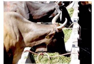
A la izq. Panojas del sorgo forrajero CENTA SS-44 ( foto superior izq.), vacas lecheras comiendo CENTA SS-44 (foto superior der. ) y un ganadero productor de leche pesando la leche obtenida al alimentar las vacas con CENTA SS-44 (abajo foto izq.)

climáticas de El Salvador, demostrando su superioridad en su adaptación y abundante y alta calidad del forraje al compararse con muchos de los híbridos generados por CENTA.