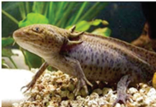
Figura 1. Ambystoma velasci del Lago de Tecocomulco, Hidalgo, México.

Estudios helmintológicos para Ambystoma en México. Los estudios helmintológicos para miembros del género Ambystoma iniciaron con Caballero y Caballero y Bravo-Hollis (1938), quienes registraron los helmintos de A. tigrinum (Green, 1825) de México registrando; dos Nematoda, Spironoura elongata Baird, 1858 y Hedruris siredonis Baird, 1858 (Tabla 1).