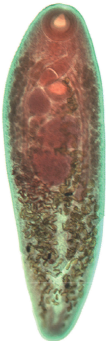
Figura 2. Cephalogonimus americanus parásito del intestino de Ambystoma velasci .

hábitos alimenticios y comportamiento del hospedero (Aho, 1990). Particularmente en el caso de las especies del género Cephalogonimus , se ha reportado que en el ciclo de vida de C. americanus los huevos son liberados del hospedero definitivo (en este caso